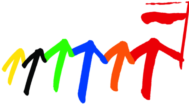
Solidarity Fund PL