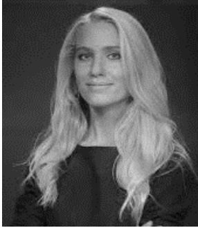
Світлана ЗАЛИЩУК Народний депутат України

У жовтні 2014 Світлану Заліщук було обрано народним депутатом України. Вона є членом Комітету у закордонних справах та головою підкомітету з питань євроатлантичного співробітництва та євроінтеграції. Світлана п'ять років працювала виконавчим директором ГО «Центр UA», яка опікується правами людини та боротьбою з корупцією. Також Світлана була координаторкою кількох впливових громадянських кампаній, включно з «Реанімаційним пакетом реформ», які після подій Євромайдану об'єднали понад 50 неурядових організацій та різних експертів у справі просування демократичних реформ і політик.