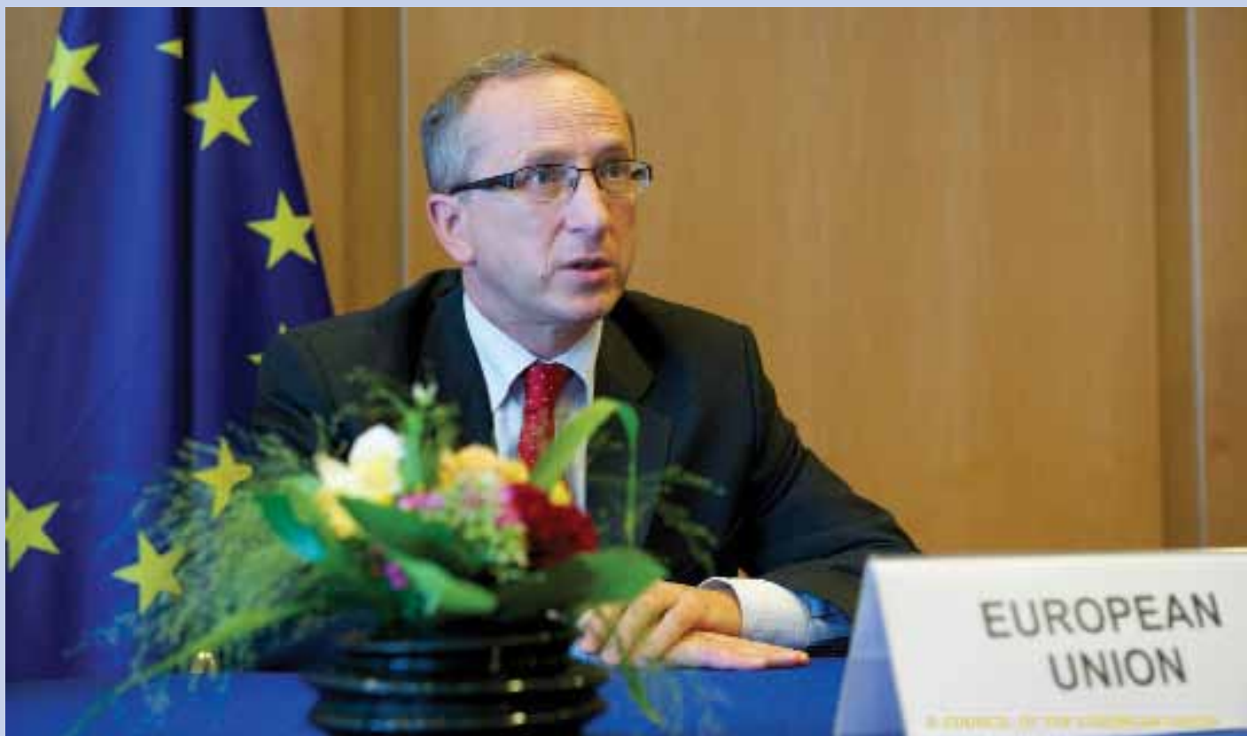
10 вересня 2012 року новопризначений Голова Представництва ЄС в Україні Посол Ян Томбінський вручив вірчі грамоти Президенту України Віктору Януковичу.